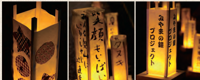
みやまの鐘プロジェクトキャラクター